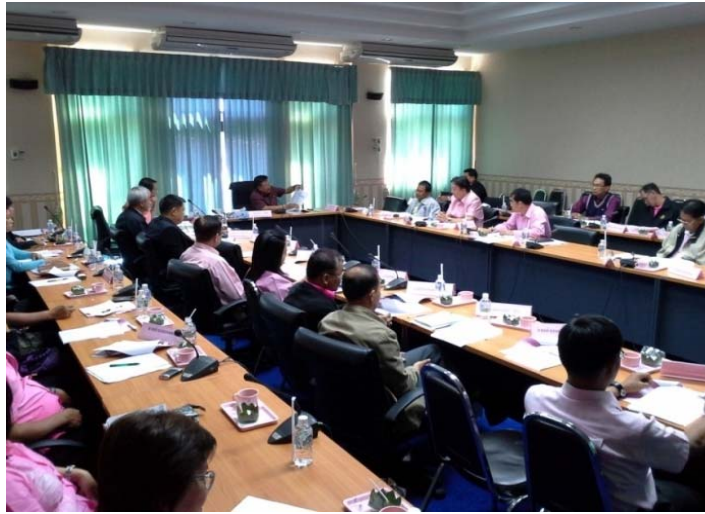
นายประชา เตรีตน์ หัวหน้าผู้ตรวจราชการกระทรวงมหาดไทย ตรวจติดตามโครงการป้องกันและแก้ไขปัญหายาเสพติดและจัดระเบียบสังคม ในพื้นที่ จ. อำนาจเจริญ